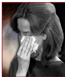
imagen bella de Dios victima de abuso y violencia inmigrante - extranjera débil y fuerte testigo de la vida y de la resurrección líder de la comunidad y de la Iglesia

Mujer, Mujer, Mujer, Mujer, Mujer, Mujer,